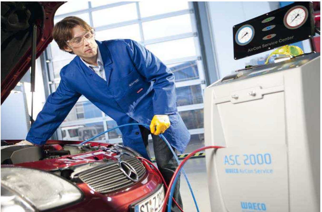
Bild 1 Nach jedem Kompressorschaden ist das Spülen des Kältemittelkreislaufs absolute Pflicht, um alle Feststoffe aus dem System zu entfernen.

Hinweis: Feste Fremdkörper können auch vom Trockner (Granulat) oder von den Kältemittelleitungen, deren Inneres sich ebenfalls auflösen kann, stammen.