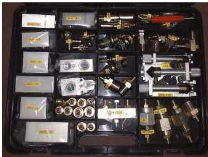
Bild 3 Spüladapterset zum Spülen aller Klimaanlage des Typs R134a. Diese Adapter erlauben das Kurzschließen des Kompressors und des Expansionsventils, das Anschließen an alle Schlaucharten wodurch die verschiedenen Kreislauftteile separat gespült werden können.